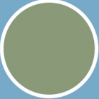
Mat Soluk Yeşil