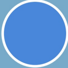
Yas Marina Blue